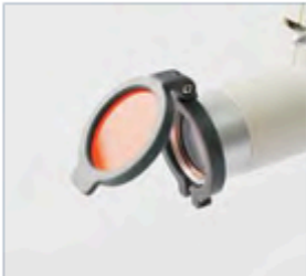
Sarı Filtre (Opsiyonel)&