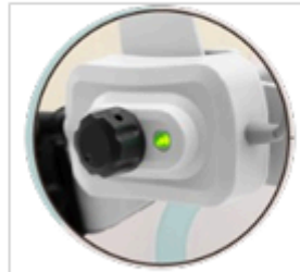
Parlaklık Ayar Tuşu&