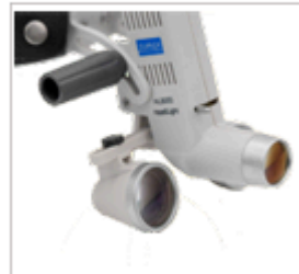
ZumaX'ın tüm Döner Büyüteçlerine uyum sağlar&