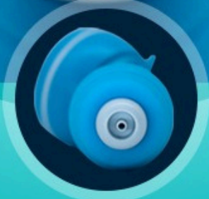
NEGATİF BASINÇ VAKUM BAĞLANTISI