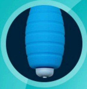
TEK ELLE ŞİŞİRİLEBİLİ PUAR