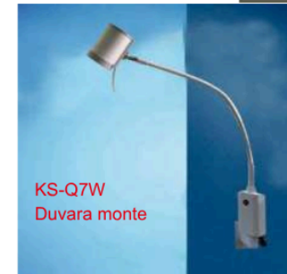
KS-Q7W Duvara monte