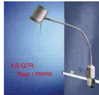
KS-Q7R Raylı monte