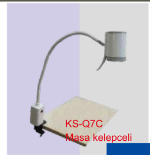
KS-Q7C Masa kelepçeli